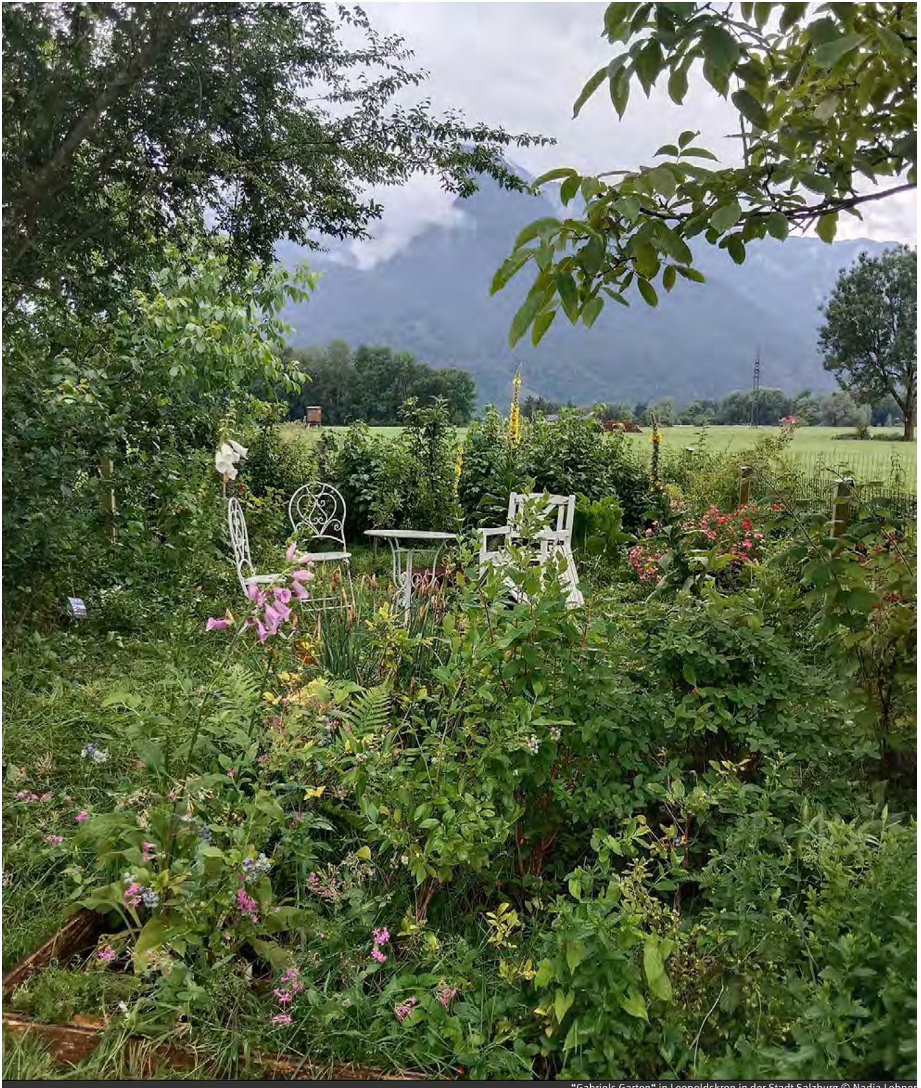
„Gabriels Garten“ in Leopoldskron in der Stadt Salzburg

Köhler, K. (2025). Future Skills: Nachhaltiges und naturbasiertes Ressourcen- und Stressmanagement. Mentale Gesundheit im Sinne von Planetary Health. Springer Verlag.